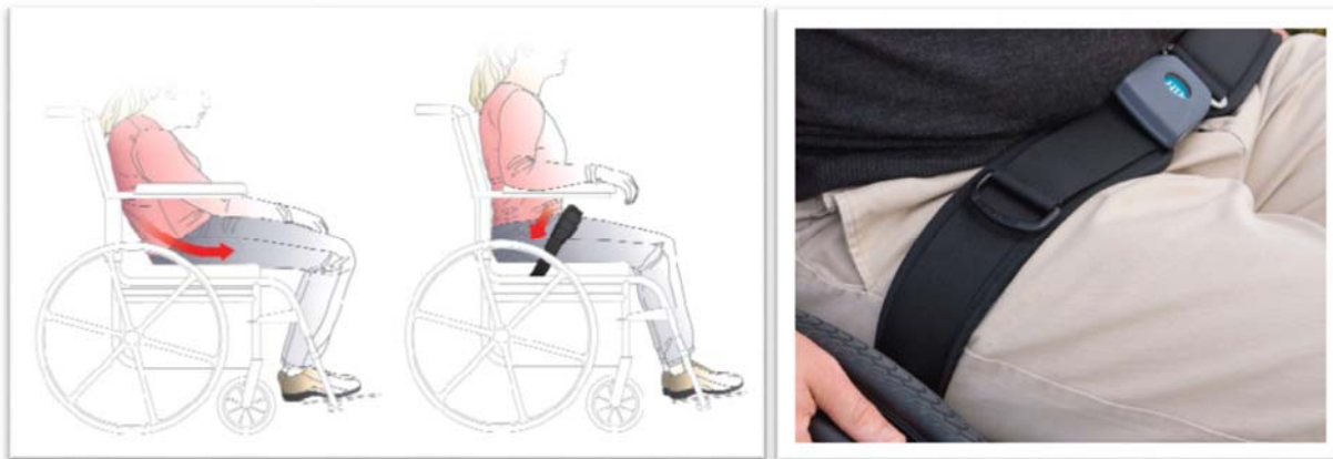
Unkorrigierte Positionierung Verbesserte Positionierung mit einem 2-Punkt Gurt

Der 2-Punkte Gurt ist besonders gut geeignet für eine Positionierung der Oberschenkel in einem 60° - 90° Winkel. (Hintere Hüftkipfung).